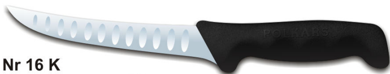
Nr 16 K Długość ostrza: 150 mm

Nóż Polkars Nr 16 K Długość ostrza: 150 mm